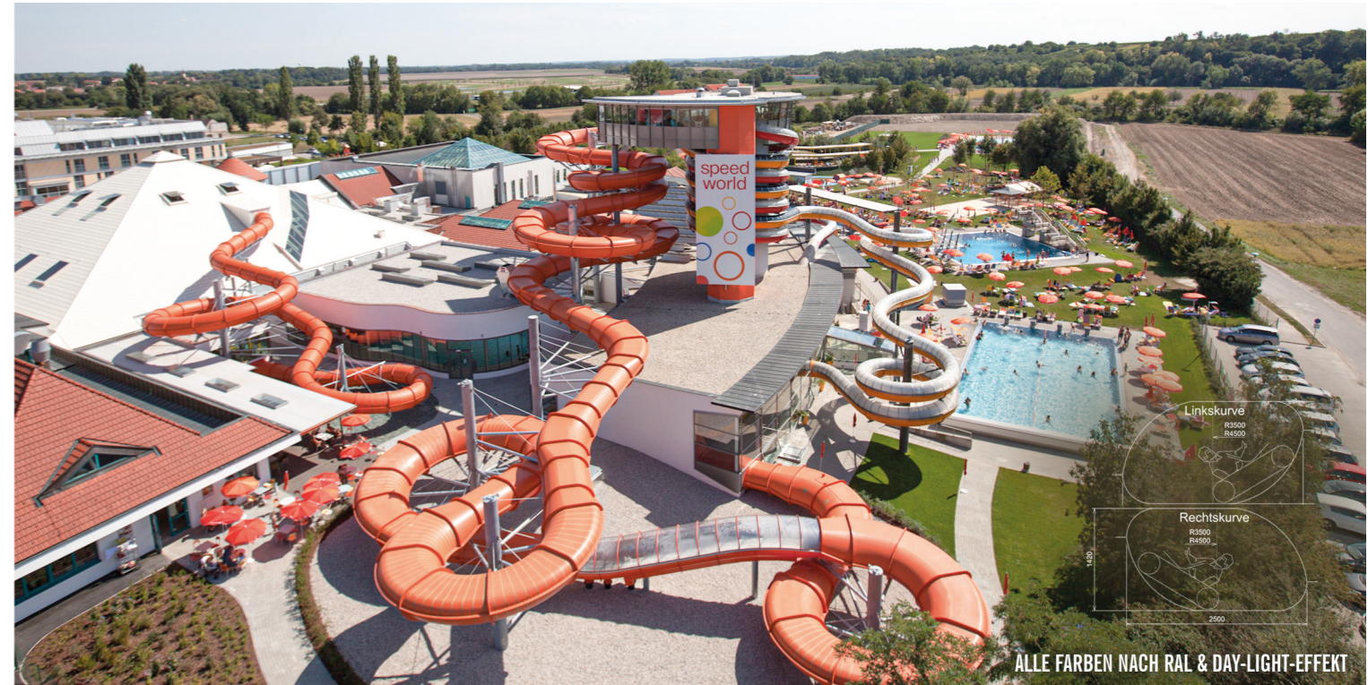
ALLE FARBEN NACH RAL & DAY-LIGHT-EFFEKT

Es sind Einer-, Zweier- oder Dreier-Reifen, mit denen man abwärts schlittert und die beliebige Kombinationsmöglichkeiten erlauben. Besonders an dieser Rutsche sind Ihre überhöhten Kurven sowie ein speziell entwickeltes Übergangselement das den fast nahtlosen Wechsel von Links- zu Rechtskurven erlaubt. Die Wechsel von Beschleunigung und Kreiselbewegungen bieten den Nutzern maximalen Badespaß. Bis zu 720 Personen pro Stunde können den Family Twister nutzen, sodass das allbekannte „Nochmal, Papa!“ niemals ein Problem darstellt. Optionale transluzente Streifen und Bullaugen, die für ein aufregendes Lichtspiel der Sonne sorgen, unterstreichen den Familiencharakter der Rutsche. Übrigens ist auch die offene Version möglich: die Version Family Twister Cabriolet.